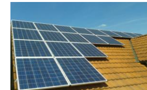
Mieter-Strom Wolfersdorf, 2015