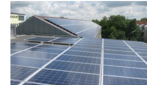
100 kWp Grund- und Mittelschule Eching, Baujahr 2013