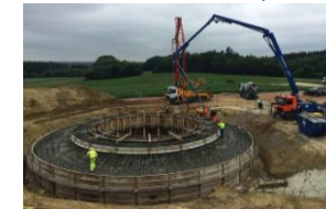
Juni 2015: Fundamentbau

3.000 kW, 6,2 Mio. kWh CO 2 - und atommüllfreien Stromertrag 115 m Rotordurchmesser, 149 m Nabhöhe, 5,5 Mio. Euro Investition