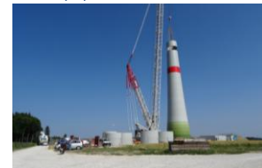
Juli 2015: Turmbau