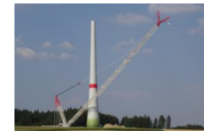
August 2015: fertiger Betonturm