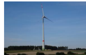
November 2015: Inbetriebnahme