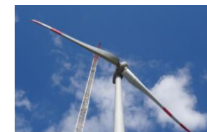
September 2015: Flügelmontage