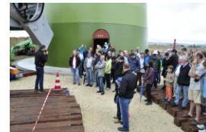
und Tag der offenen Baustelle