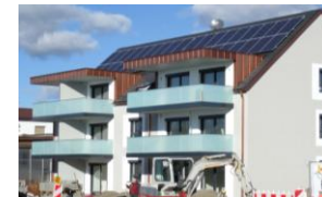
Mieter-Strom Hallbergmoos, 2015