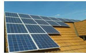
9,4 kWp Photovoltaik-Mieter-Strom Wolfersdorf, 2015