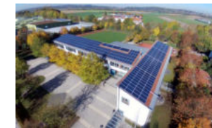
100 kWp Bürger-Solardach-Grundschule Eching, 2017