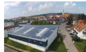
159 kWp Bürger-Solardach Turnhalle Nandlstadt, 2018