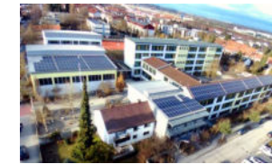
100 kWp Bürger-Solardach - Grund und Mittelschule Eching, 2013