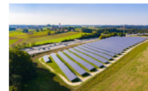
1.750 kWp Bürger-Solarpark Paunzhausen, 2020