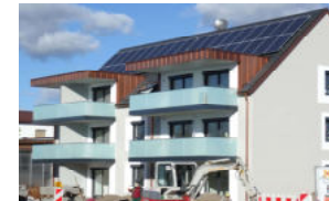
9,5 kWp Photovoltaik-Mieter-Strom Hallbergmoos, 2015