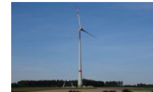
3.000 kW Bürger-Windrad Kammerberg, 2015