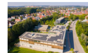
100 kWp Bürger-Solardach Montessorischule Freising, 2020